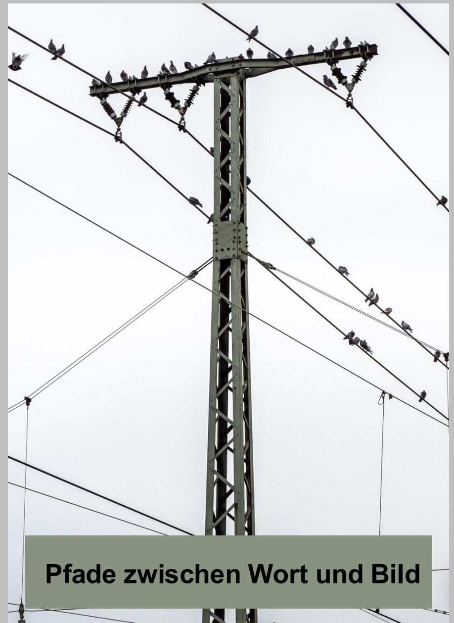
Pfade zwischen Wort und Bild