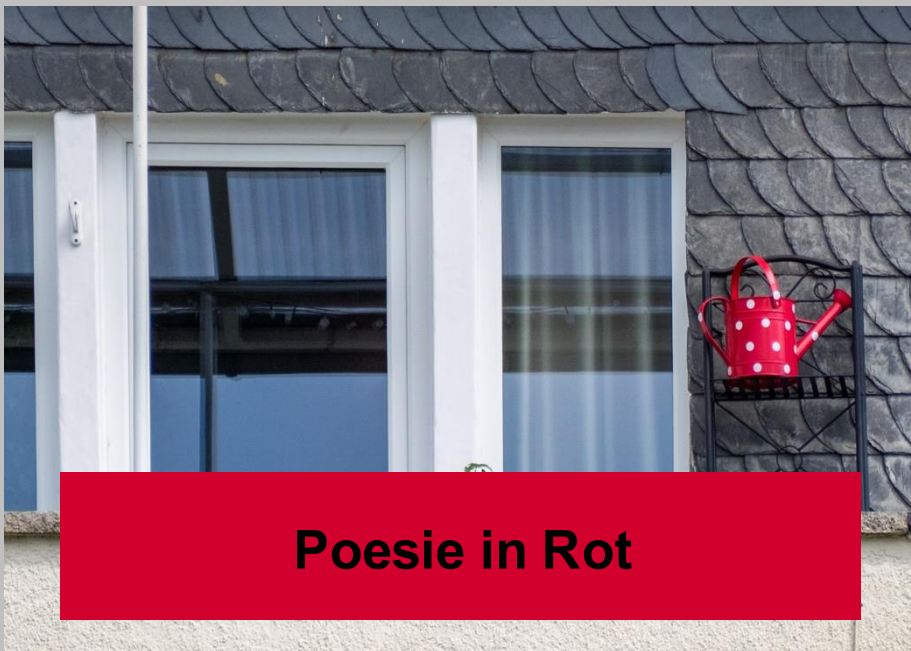
Poesie in Rot